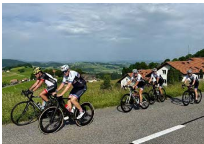
Le groupe 2 dans la montée du Guggisberg, d'où la vue s'étend, par temps clair, jusqu'au lac de Neuchâtel.