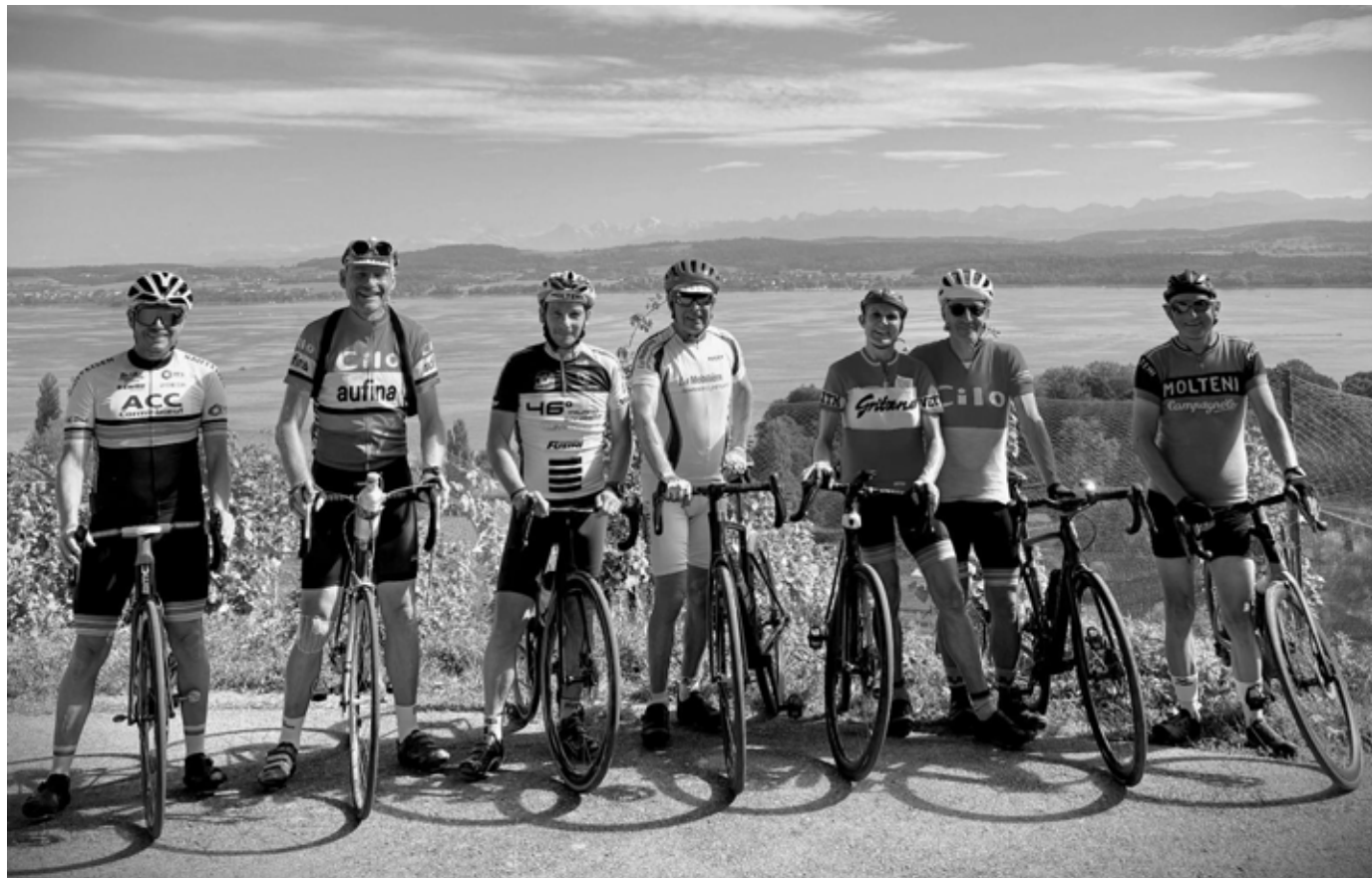
Cherchez l'intrus !