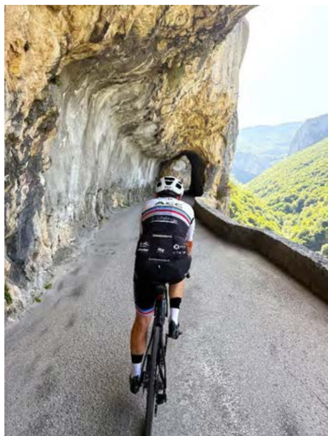
La spectaculaire route des Gorges du Nan qui mène au col du Mont Noir après une ascension exigeante de 16 km.