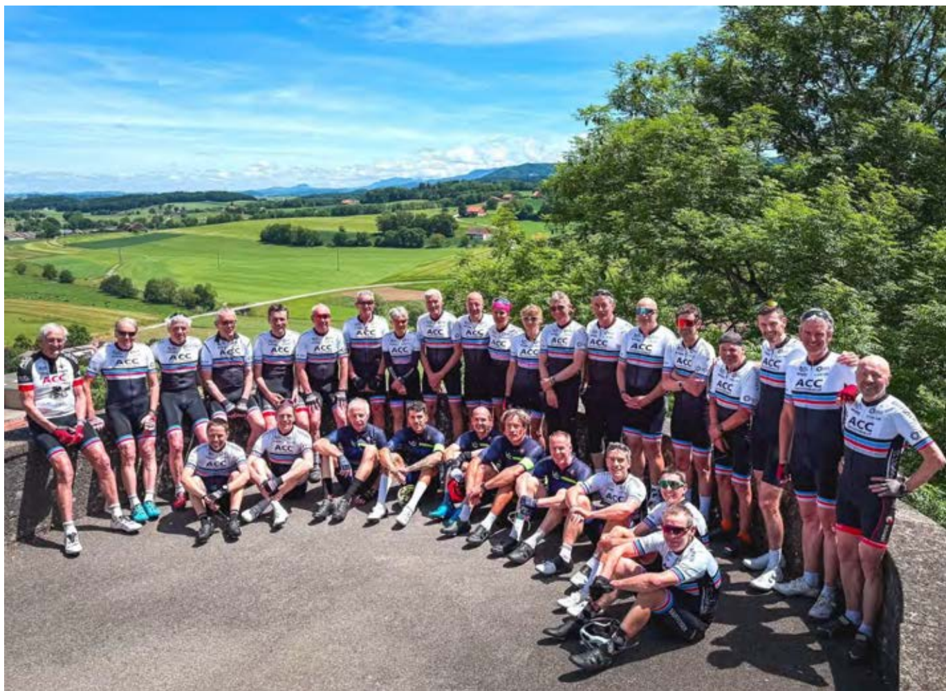
Les ACC sur les remparts de Romont lors de l'édition 2025. Ils sont accompagnés pour l'occasion par 5 membres du VC 80 de Delémont. La participation est toujours importante pour cette classique du jeudi de l'Ascension.

Inscriptions sur le groupe WhatsApp des ACC auprès de Fred Allègre jusqu'au samedi 9 mai.