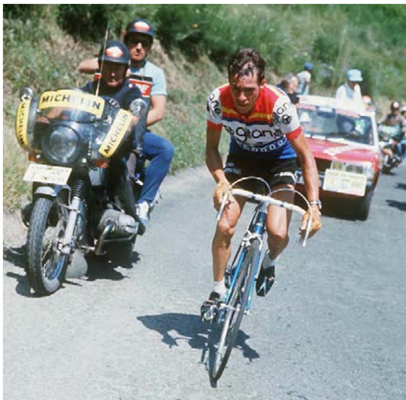
Lucien Van Impe lors de son Tour de France victorieux, dans un style qui rappelle celui des grands grimpeurs des années 50/60.