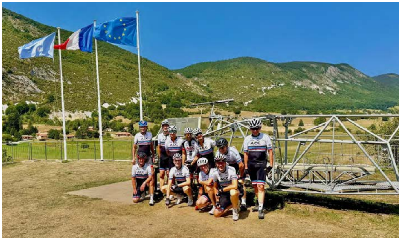
Au Mémorial de la Résistance à Vassieux-en-Vercors, les groupes 1 et 2 posent devant un des 24 planeurs allemands ayant attaqué le village en juillet 1944. Moment de recueillement et d'émotion pour les ACC...