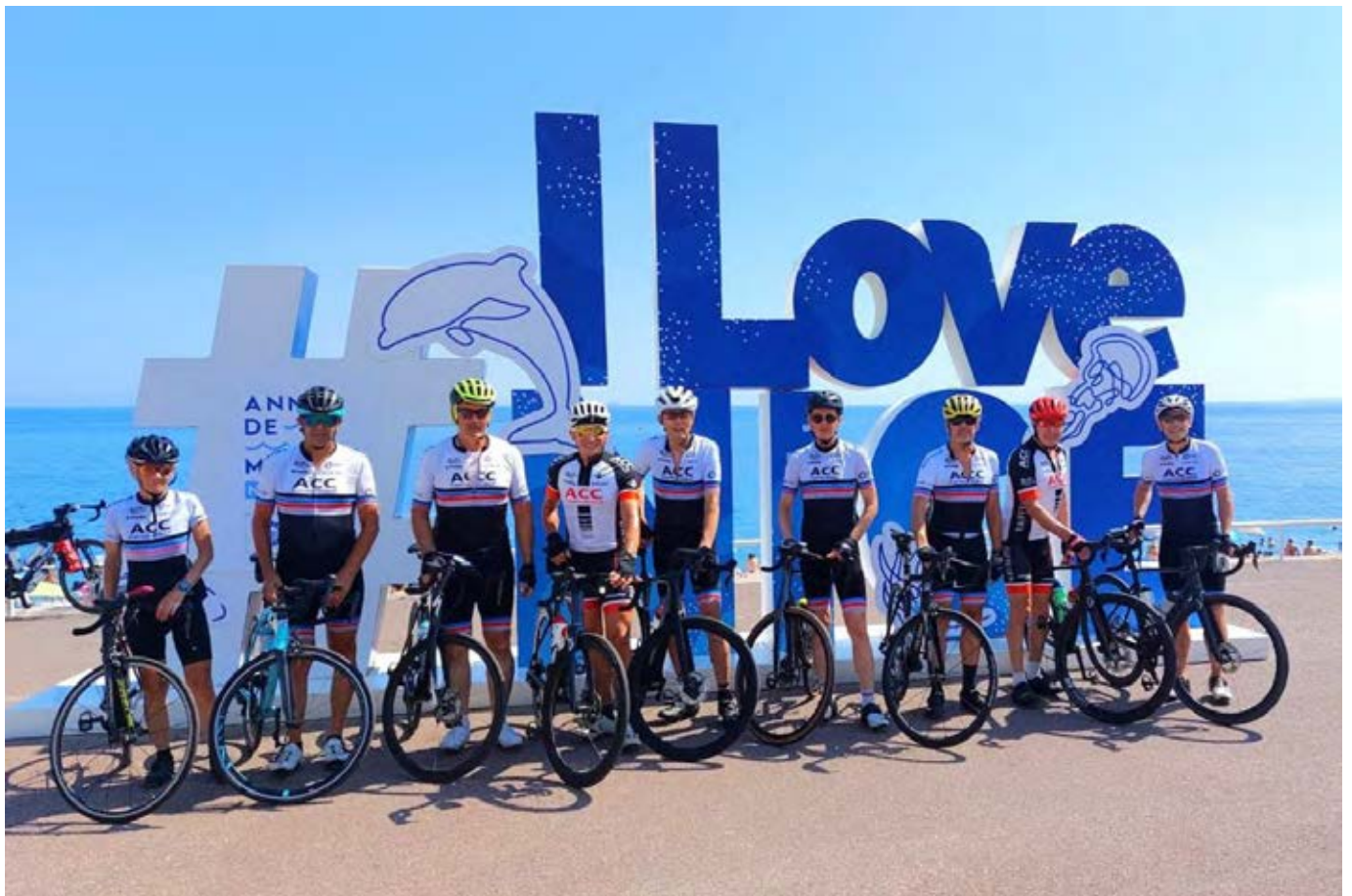
Le groupe 3 sur la Promenade des Anglais semble être tombé amoureux de Nice, de sa plage, de son arrière-pays et de ses villages perchés. Ces paysages grandioses, la météo favorable et l'ambiance extraordinaire durant tout le séjour ont contribué à ce que cette sortie à la Turbie soit à coup sûr gravée dans la mémoire des ACC !