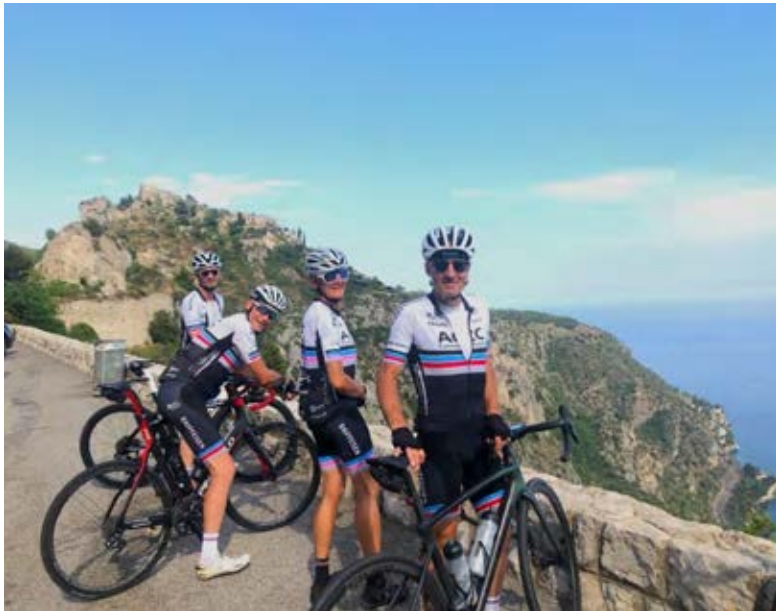
Quelques ACC en admiration devant le panorama qui s'offre à eux sur la route de la Moyenne Corniche. On distingue en arrière-plan le village d'Eze.