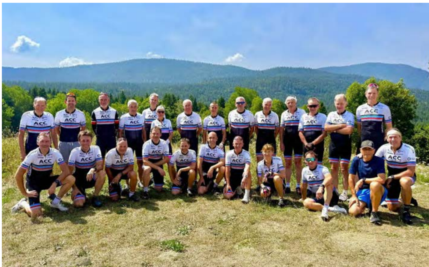
Tous les ACC présents pour cette sortie de la Mi-Août 2025 dans le Vercors posent pour la photo souvenir sur la terrasse du restaurant le 3636 dans le village de Bois Barbu, en dessus de Villard-de-Lans.