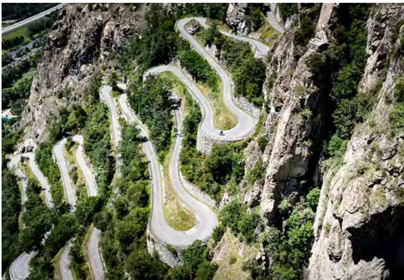
Les célèbres lacets de Montvernier qui conduisent au col de Chaussy

Une soirée d'information, avec présentation des parcours, aura lieu le mercredi 5 août 2026 à 19h30 à la Mansarde, au 2 ème étage de l'administration communale de Corminboeuf.