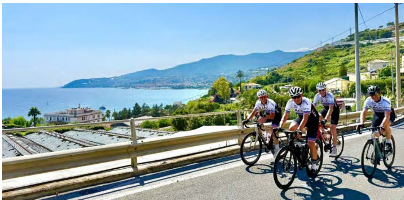
Le groupe 1 dans le Poggio, lors de la 1 ère étape de la sortie de la Fête-Dieu à la Turbie. Avec le Capo Berta et la Cipressa, les ACC ont pu réaliser la fin de la fameuse classique "Milan – San Remo".