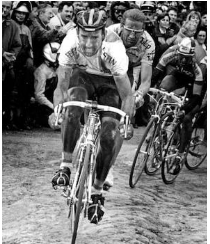
... ou sur Paris - Roubaix, classique qu'il gagna également à 2 reprises.