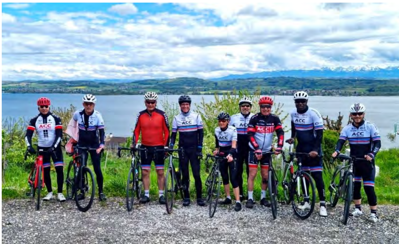
Lors de la sortie de Pâques 2025 dans le Vully, les participants du groupe 3 gardent le sourire malgré la météo mitigée.