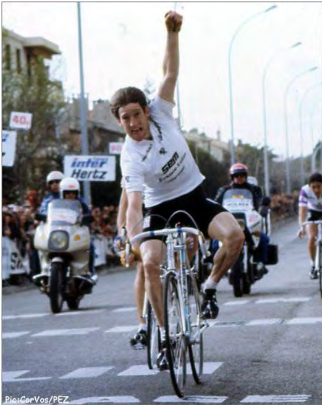
Chasseur de classiques comme ici à Liège - Bastogne - Liège, dont il fut 2 fois vainqueur ...

Troisième des championnats du monde en 1982, 5 e en 1986 et encore 3 e en 1989, ses admirateurs peuvent nourrir le regret que ce coureur talentueux n'ait pas pu décrocher le titre, notamment lors des championnats du monde de 1989 à Chambéry. Néanmoins, Sean Kelly reste aujourd'hui encore l'un des coureurs cyclistes les plus titrés de l'histoire du cyclisme.