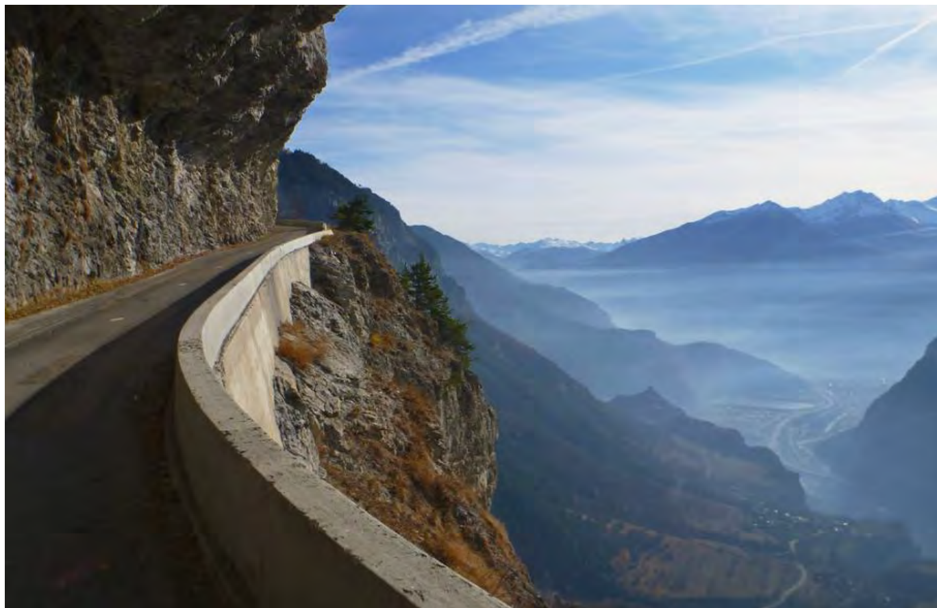
La montée par le col du Chaussy avant de rejoindre le col de la Madeleine

Pour les sportifs que sont les ACC, rouler à l'assaut du Col de la Madeleine après avoir franchi le col du Chaussy par les célèbres lacets de Montvernier constituera sans aucun doute non seulement une première, mais certainement aussi un des points forts de la sortie. Mais ne vous inquiétez pas, d'autres beaux défis à réaliser dans des décors de rêve seront proposés.