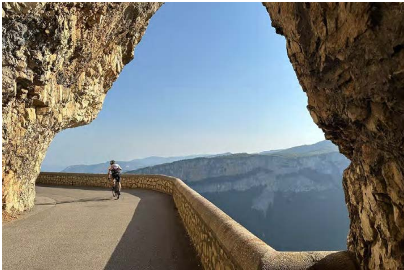
Un ACC seul au monde, perdu dans ce paysage grandiose de la route de la Combe Laval.