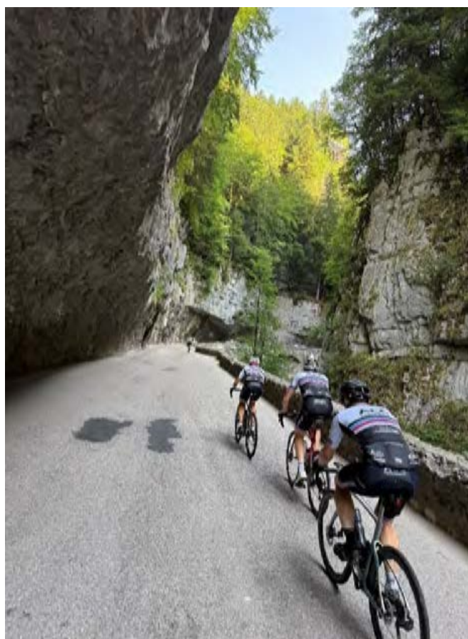
Tout aussi spectaculaire, la route des Gorges de la Bourne qui serpente entre des parois rocheuses pouvant atteindre 300 m de hauteur.