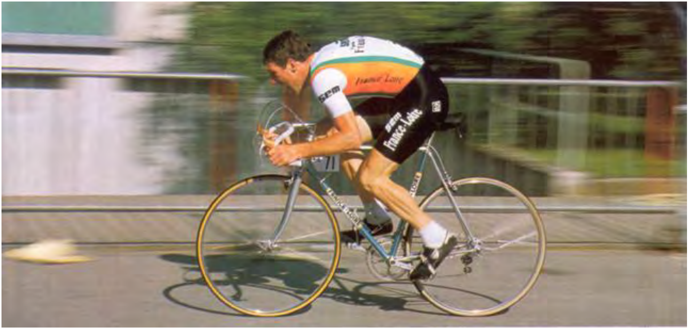
Redoutable rouleur de contre-la-montre ...

Troisième des championnats du monde en 1982, 5 e en 1986 et encore 3 e en 1989, ses admirateurs peuvent nourrir le regret que ce coureur talentueux n'ait pas pu décrocher le titre, notamment lors des championnats du monde de 1989 à Chambéry. Néanmoins, Sean Kelly reste aujourd'hui encore l'un des coureurs cyclistes les plus titrés de l'histoire du cyclisme.