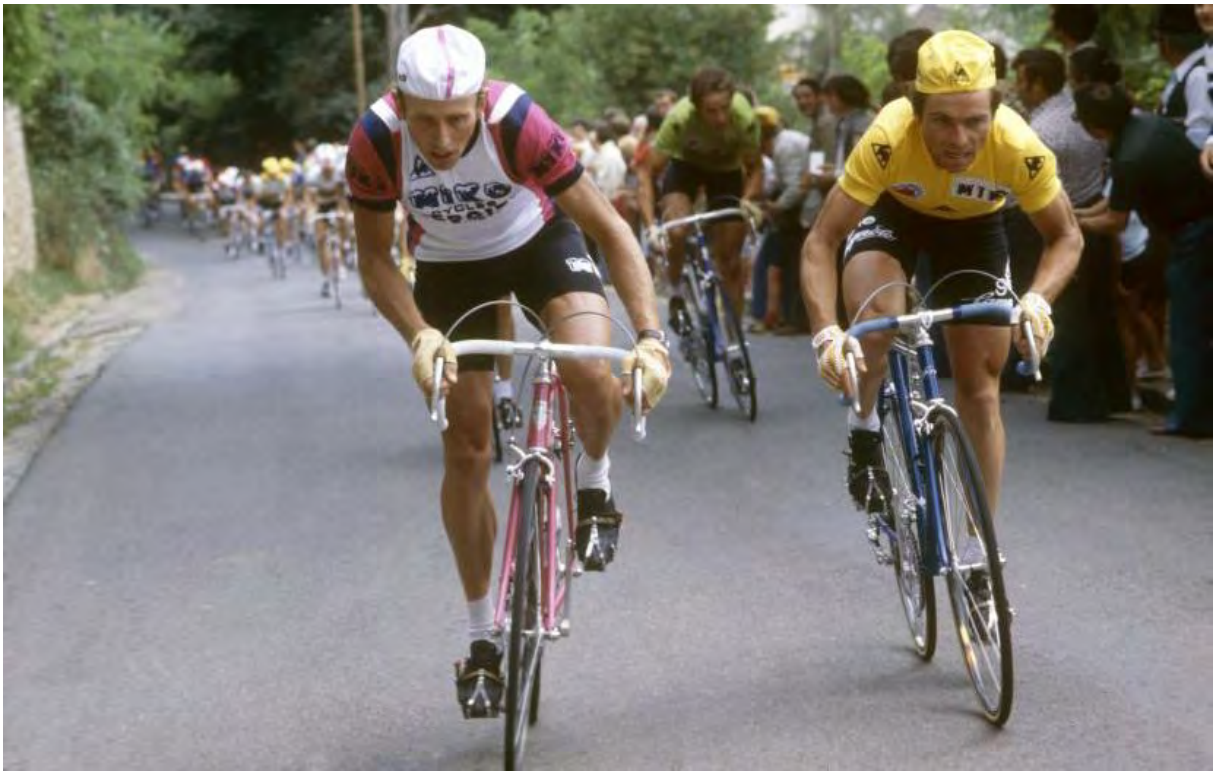
Joop Zoetemelk a donné beaucoup de fil à retordre à Bernard Hinault, maillot jaune. Au centre avec le maillot vert, Dietrich Thurau.

Il a participé à 16 Tours de France sans jamais en abandonner un seul. En 1970, pour sa première année chez les professionnels et sa première participation, il termine 2 e du Tour de France derrière Eddy Merckx. Il sera encore 2 e en 1971 toujours derrière Eddy Merckx et encore 2 e en 1976 derrière Lucien Van Impe. Puis 2 e en 1978, 79 et 82 derrière Bernard Hinault.