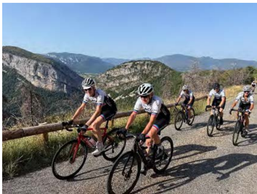
Dans une nature sauvage et encore préservée, les ACC gravissent le magnifique col de Toutes Aures. Petite mise en bouche avant d'affronter les Gorges du Nan.