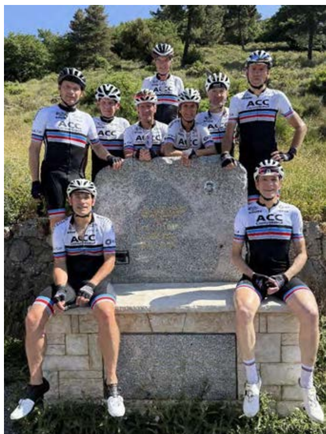
Groupes 1 et 2 réunis au sommet du col de Braus sur la stèle du cycliste français René Vietto, grimpeur d'exception des années trente.