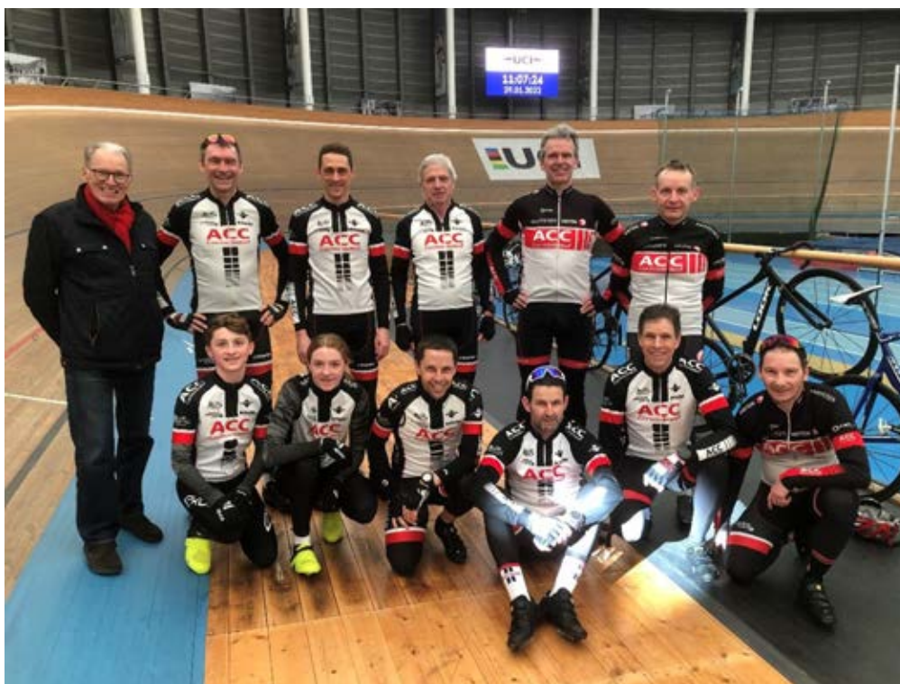
Photo de la sortie 2022 avec la présence de deux juniors dont une demoiselle qui a montré de belles aptitudes pour la piste. L'avenir des ACC semble assuré...

Expérience à réaliser absolument pour celles et ceux qui ne l'auraient pas encore tentée. La piste nous est réservée durant les deux heures de l'initiation et un moniteur encadre les débutants.