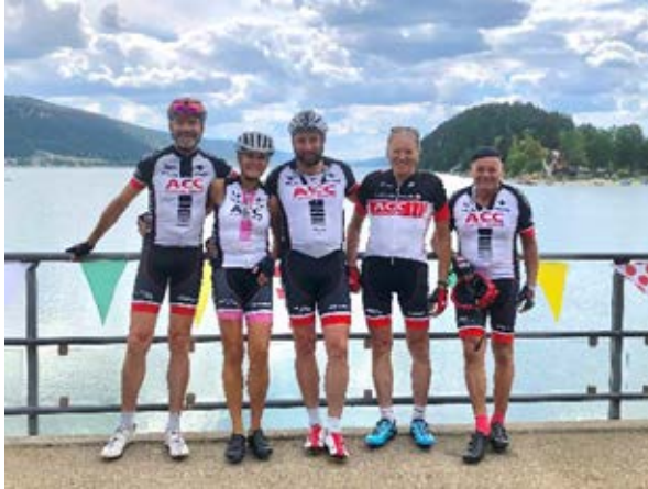
Les 5 participants à l'édition 2022 à la pause de midi devant le Lac de Joux lors de la 1 ère étape.