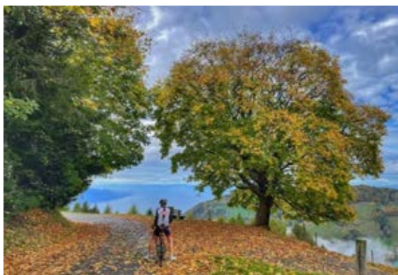
Un ACC s'extasie devant le point de vue sur la route au-dessus des Avants

No 100.2 : Variante depuis Corminboeuf : 163 km 2770 m