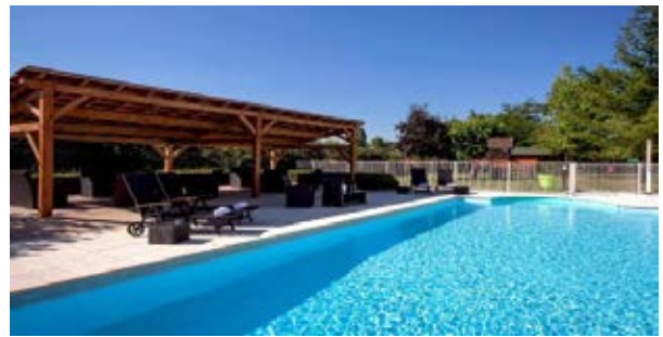
L'hôtel Carline de Beaune est situé au cœur de la Bourgogne, sur la route des Grands Crus, à seulement 800m des célèbres Hospices de Beaune.

Les tracés du parcours itinérant de même que ceux des parcours sur place qui nous permettront de découvrir notamment les spectaculaires vignobles de Bourgogne sont en cours d'élaboration. Ils seront accessibles à l'ensemble des participants.