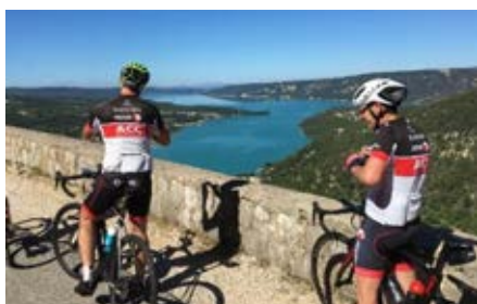
Les ACC sur la route entre Moustiers-Sainte-Marie et Aiguines avec le magnifique lac de Sainte-Croix en arrière-plan.

2018 Pour célébrer ses 25 ans, le club a organisé à la Fête-Dieu, une sortie inoubliable à Gréoux-les-Bains . Situé dans les Alpes de Haute-Provence à la porte des gorges du Verdon, des lacs de Sainte-Croix et d'Esparron, cette région offre des paysages remarquables que les ACC ont pu admirer lors de ce séjour dans la cité thermale.