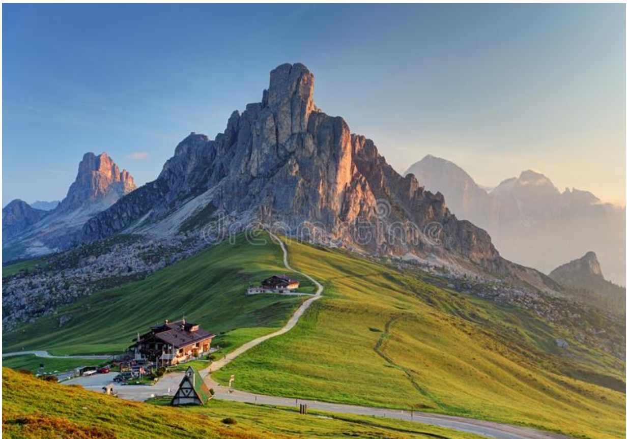
Le Passo Giau, col que les ACC auront l'occasion de gravir, offre un décor extraordinaire que les ACC pourront admirer à leur arrivée au sommet.

Qui dit col dit aussi dénivelé positif. Effectivement, il s'agira d'une sortie montagnaise. Mais soyez rassuré, celle-ci n'est absolument pas réservée aux « cadors » des ACC. Au contraire, les étapes comporteront des distances raisonnables avec des variantes qui permettront à chacun d'y prendre part et d'y trouver un maximum de plaisir.