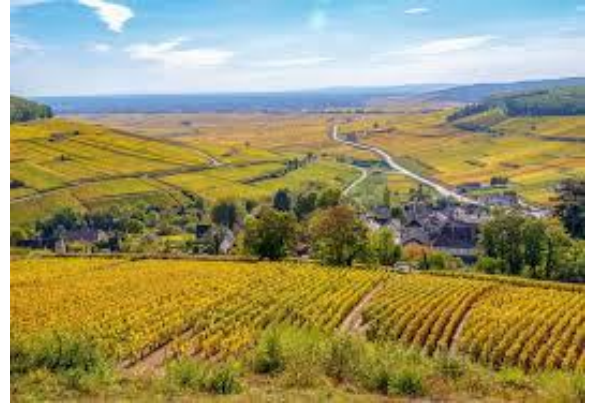
Le vignoble bourguignon produit des vins réputés dans le monde entier

Afin de marquer de manière significative le 30ème anniversaire du club ACC, cette sortie est proposée selon deux variantes :