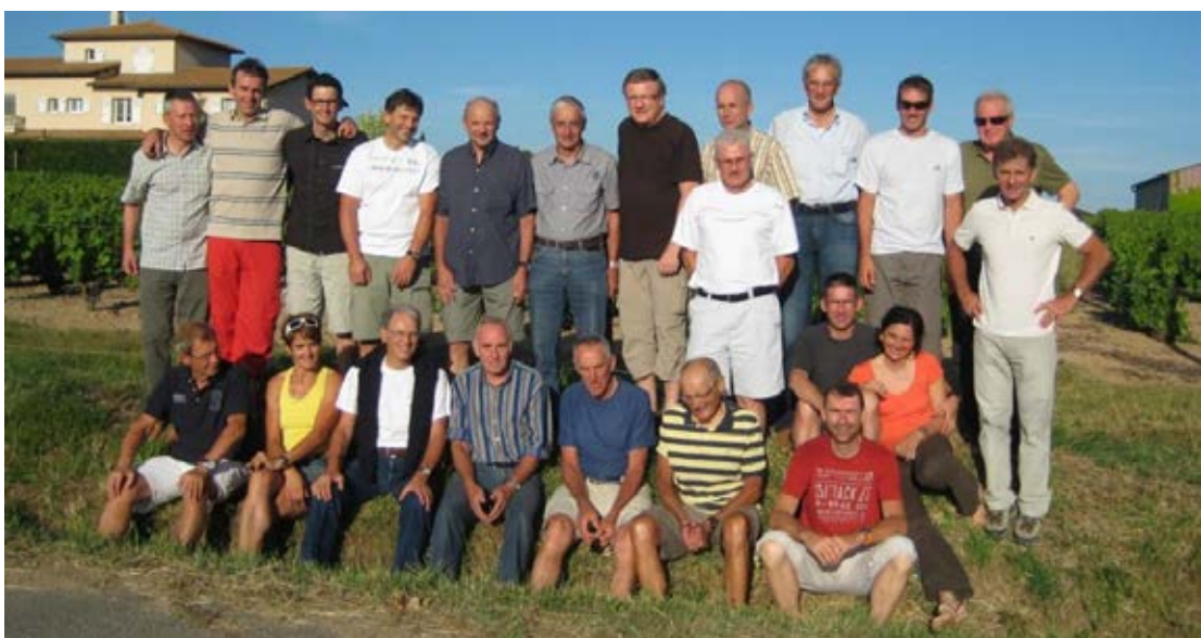
Les ACC entourant Joop Zoetmelk lors de la sortie de la Fête-Dieu 2009 à Villiers-Morgon, dans le Beaujolais.