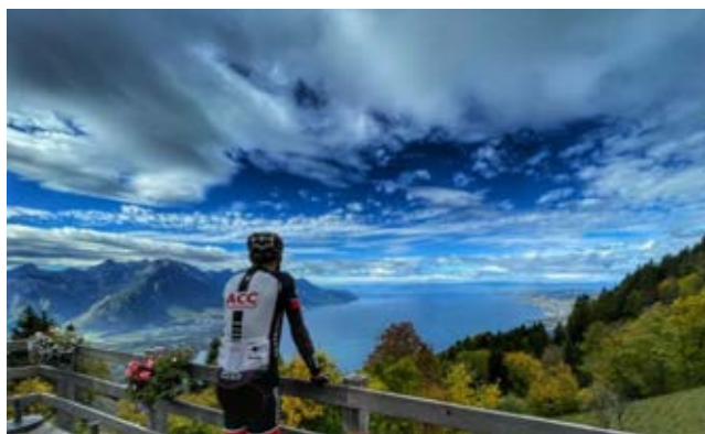
et depuis la terrasse du restaurant de Sonchaux...

Du 26 août au 17 septembre : Tour d'Espagne