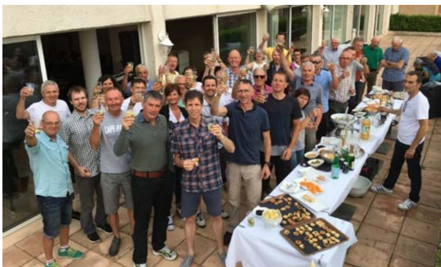
Cet anniversaire méritait bien un apéritif avec quelques petits fours.