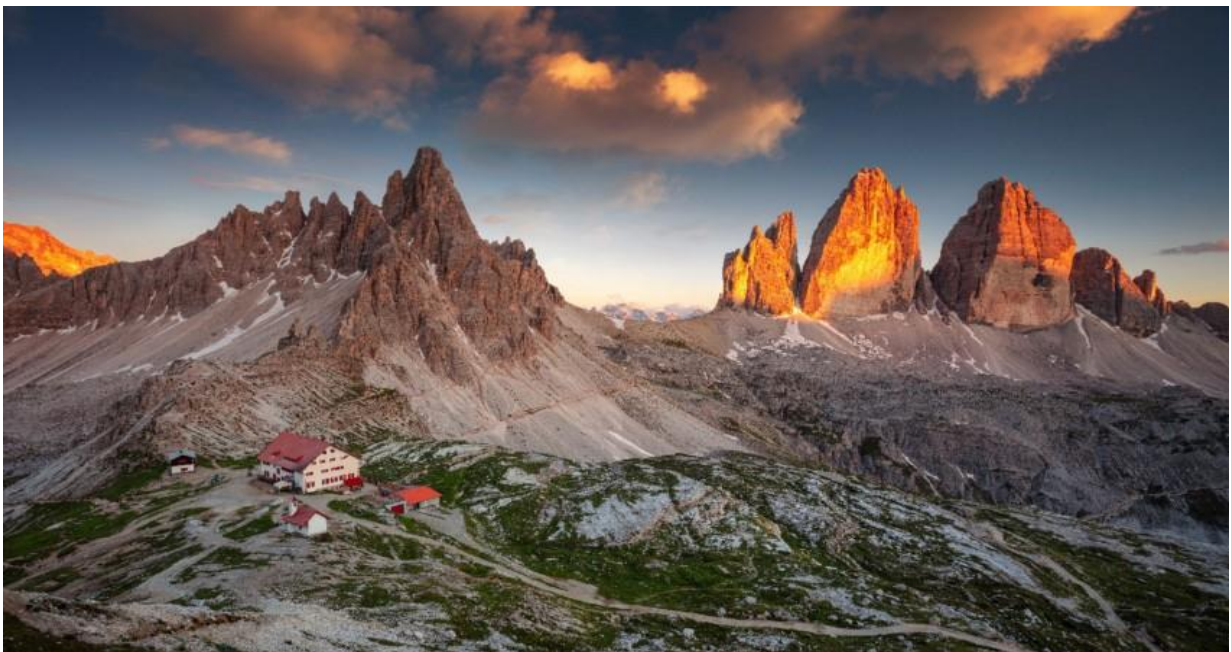
Les Tre Cime di Lavaredo et son arrivée au refuge Auronzo constitue une ascension cycliste notable du Tour d'Italie

Le Tour d'Italie 1967 est le premier du jeune coureur belge Eddy Merckx âgé de 22 ans, qui y remporte les 12 e et 14 e étapes. Felice Gimondi remporte la 19 e étape au sommet des Tre Cime di Lavaredo , devant Merckx et Gianni Motta, mais l'étape est annulée car beaucoup de coureurs profitent de "poussés" répétés des supporters italiens dans la montée sous de fortes chutes de neige. Felice Gimondi, qui aurait dû revêtir le maillot rose à l'issue de cette étape, menace d'abandonner. Mais il se ravise et remporte le premier de ses trois Giro à la suite d'un duel épique avec Jacques Anquetil sur le Passo del Tonale et le col de l'Aprica.