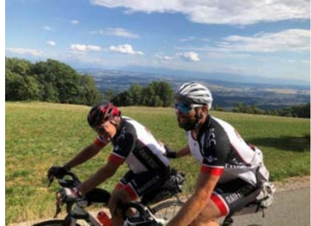
Même si la fin de la 1 ère étape ne fut pas piquée des vers, la solidarité affichée a permis à chacun de rejoindre l'arrivée.