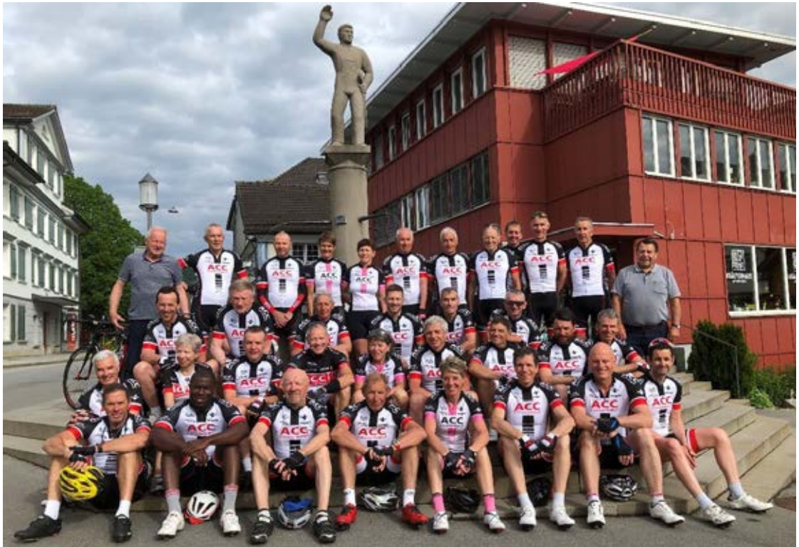
35 ACC sur la place de la Landsgemeinde à Appenzell prêts pour le vote à main levée. Vont-ils faire basculer la majorité ?

2021 Sortie de la Fête-Dieu en Appenzell lors de la crise sanitaire du Covid-19. Elle fut organisée au pied levé en remplacement de la sortie en Auvergne reportée pour cause de pandémie. Les ACC ne furent pas déçus par cette magnifique découverte de la Suisse orientale. Il n'est pas toujours nécessaire de traverser les frontières pour trouver son bonheur.