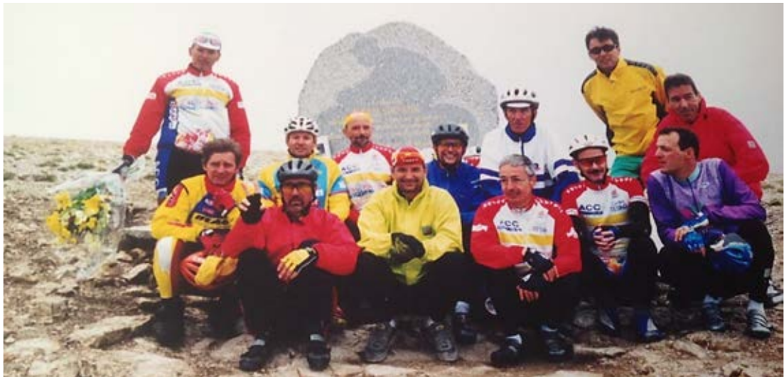
Une partie des ACC est redescendue jusqu'au monument de Tom Simpson, situé à 1 km du sommet du mont chauve, pour y déposer avec émotion une gerbe de fleurs en hommage au Champion disparu à cet endroit, lors du Tour de France 1967. Il faisait froid ce 3 août 2000 au sommet du Mont Ventoux

2000 L'an 2000 restera pour les ACC un souvenir extraordinaire. Cette année-là, un important peloton est allé de Corminboeuf au mythique Mont Ventoux en 6 jours consécutifs, du 29 juillet au 4 août. Des cyclistes qui n'étaient pas des grimpeurs chevronnés et qui ont mis un point d'honneur à gravir le géant de Provence, avec une satisfaction inénarrable et des émotions à peine contenues à leur arrivée au sommet. Cela, après avoir franchi les cols de la Haute-Savoie, du Vercors et de la Drôme-Provençale.