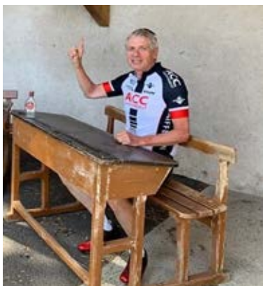
Patron, encore une tournée

Corminboeuf – Avry-sur-Matran – Seedorf – Noréaz – les Arbognes – Corcelles – Aérodrôme – Bussy – Montet – Mussillens – Châbles – Cheyres – Yvonand – Arrisoules – Monborget – Chavannes-le-Chêne – la Gaîté – Vuissens – Prahins – Ogens – St-Cierges – Corrençon – Moudon – Chav.-s/-Moudon – Brenles – Villaranon – Billens – Bois de Boulogne – Sédeilles – Corserey – Prez – Noréaz – Avry-s/-Matran – Corminboeuf 108 km 1580 m