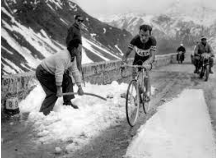
Charly Gaul dans l'ascension finale du Monte-Bondone. L'image se passe de commentaires...

« Charly Gaul a remporté le triomphe le plus complet qu'un coureur cycliste ait obtenu en une journée... C'est un exploit sans précédent dans le cyclisme contemporain. On retrouve là le caractère des étapes de montagne des temps préhistoriques. Il a fallu pour cela le cataclysme céleste, mais aussi la classe très rare et très particulière du petit Luxembourgeois... » Jacques Godet