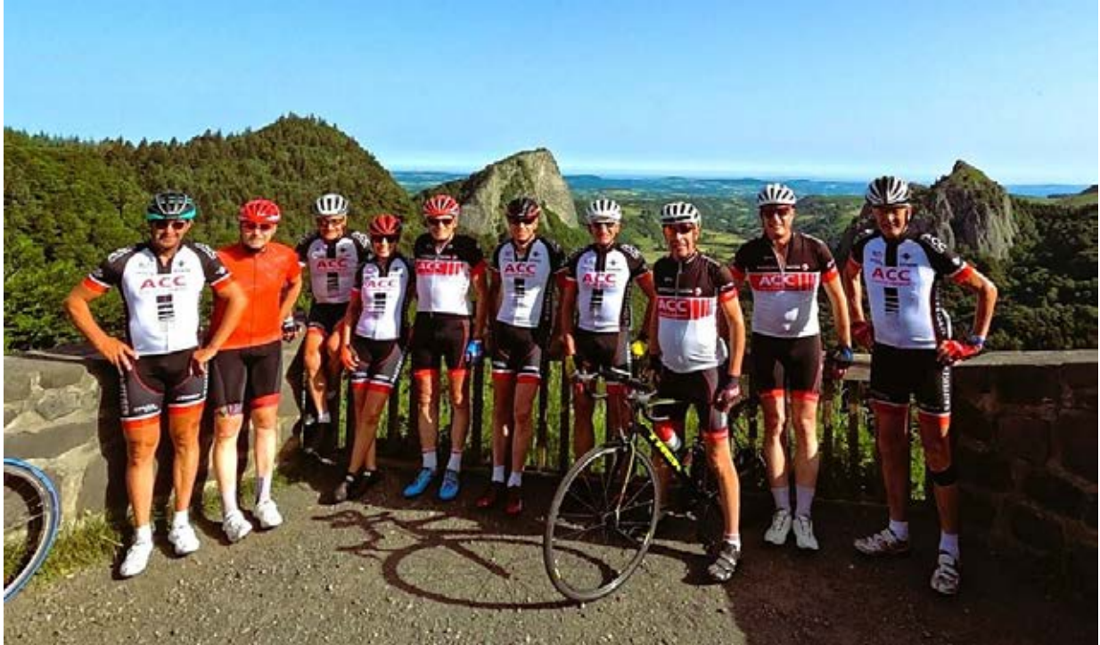
Les ACC lors de la sortie de la Fête-Dieu 2022 en Auvergne posent devant la Roche Tuillère et la Roche Sanadoire