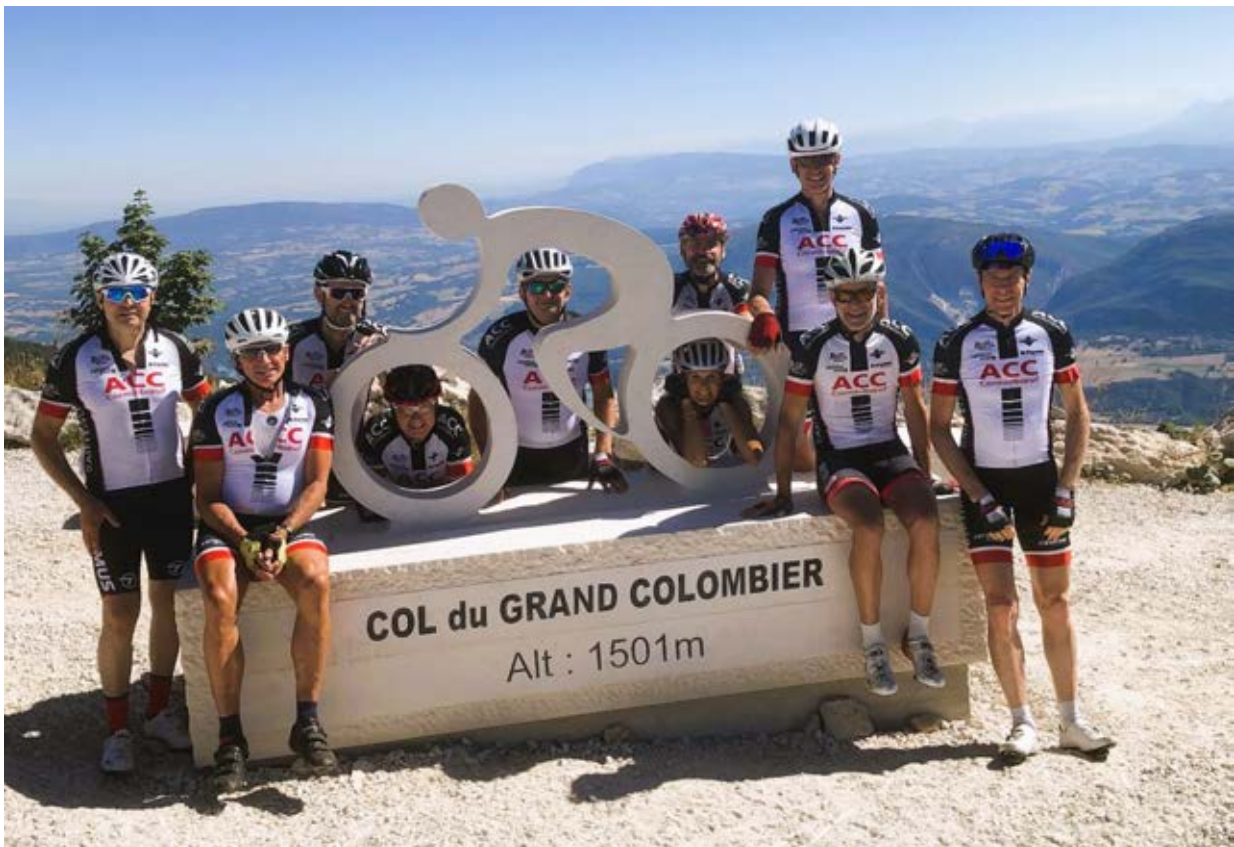
Ces mêmes ACC au sommet du col du Grand Colombier lors de la sortie de la Mi-Août 2022 à Aix-les-Bains

Photo de couverture : Les ACC devant le Lac Pavin lors de la sortie de la Fête-Dieu 2022 à Mont Dore en Auvergne