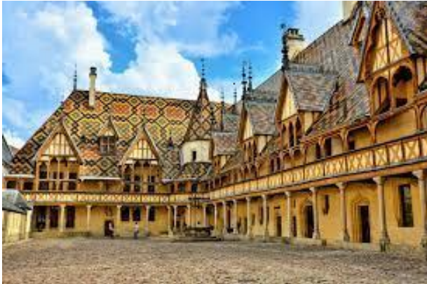
Les Hospices de Beaune, un des plus prestigieux monuments français

La Bourgogne a été classée par l'éditeur de guides de voyages Lonely Planet dans le TOP 10 des régions à explorer dans le monde en 2022. Elle a été sélectionnée pour sa célèbre gastronomie et ses vins réputés dans le monde entier, mais aussi pour ses beaux paysages naturels.